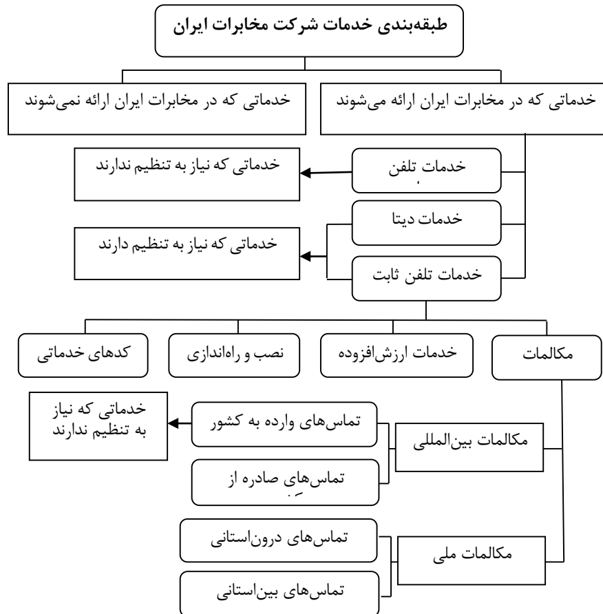
نمودار (۳): طبقه‌بندی خدمات شرکت مخابرات ایران